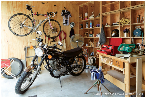
※車両やその他アイテムは撮影用小物です