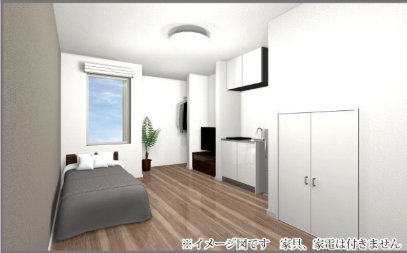
※イメージ図です 家具、家電は付きません